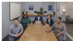
グループ フレーミング

優れた映像技術が参加者を最適な姿で映し出すので、参加者全員がまるで目の前にいるように感じられます！