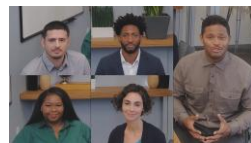
人物フレーミング