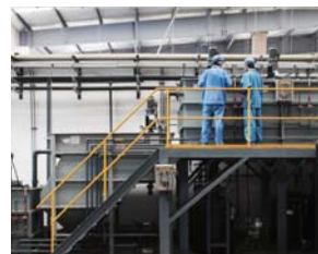
▲ 工場などでも使用が可能な防塵、防滴仕様

また、優れた冷却性能により、全モデルで最高40°Cでの連続運転が可能。さらに、モニターは防塵、防滴仕様で、手袋をした指やクレジットカードの端などでのタッチにも反応するので、多様な設置環境や利用シーンで活用できます。