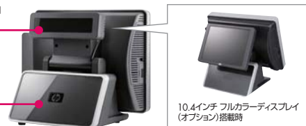
10.4インチ フルカラーディスプレイ(オプション)搭載時