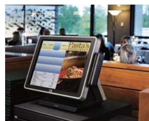
▲ コンパクトな筐体でレジ周りを有効活用