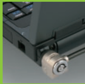
イメージ左:ドッキングステーションを接続しデスクトップとしての使用例 中:指紋認証デバイス 右:セキュリティロックケーブル