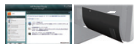
「HP ProtectTools」管理画面 セキュリティカバー