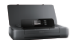
HP OfficeJet 200 Mobile A4単機能