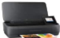
HP OfficeJet 250 Mobile AiO A4複合機