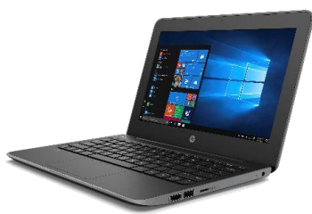
HP Stream 11 Pro G5 11.6インチ・クラムシェルPC