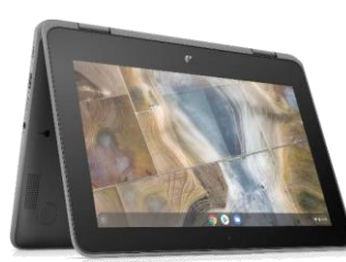
HP Chromebook x360 11 G3 EE 11.6インチ・2in1コンバーチブルPC