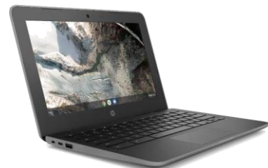
HP Chromebook 11 G8 EE 11.6インチ・クラムシェルPC