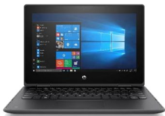
HP ProBook x360 11 G5 EE 11.6インチ・2in1コンバーチブルPC