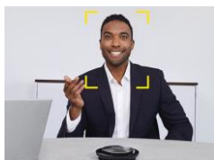
< 参加者 1 人 >

ソーシャルディスタンスでも損なわないコラボレーション 参加者の状況に応じてズームを調整