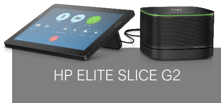
HP ELITE SLICE G2