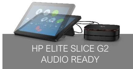
HP ELITE SLICE G2 AUDIO READY