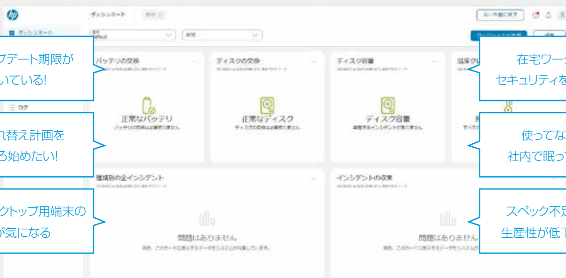
管理クラウドの画面イメージ