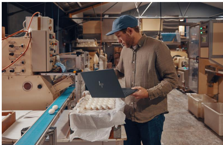
ハイブリッドワーク環境での高い生産性とコラボレーション