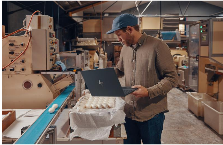
ハイブリッドワーク環境での高い生産性とコラボレーション