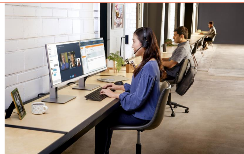
多様な働き方に合わせたモダンITへの変革課題