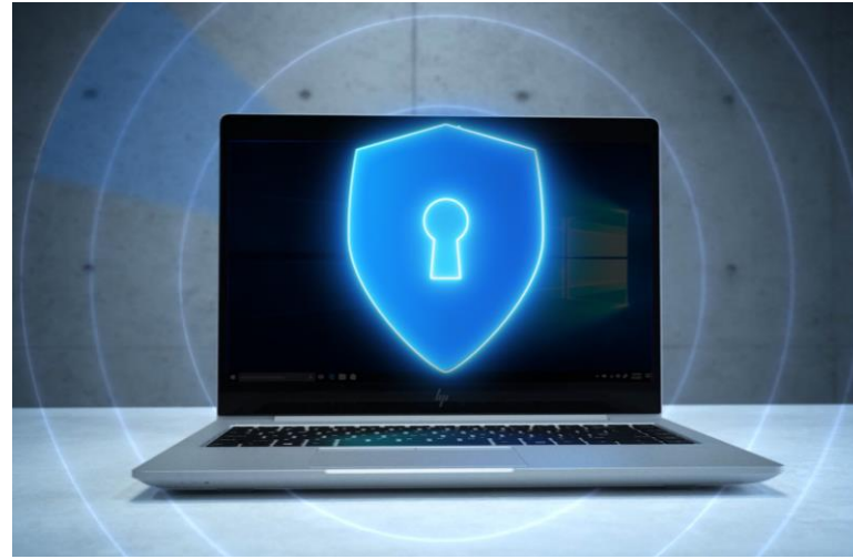
多層のセキュリティ対策