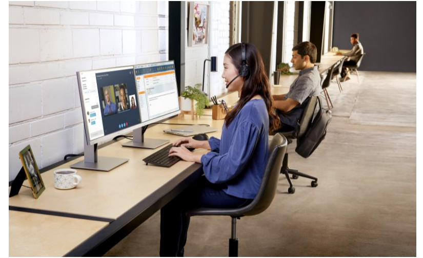
多様な働き方に合わせたモダンITへの変革