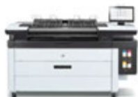
HP PageWide XL 3920 MFP