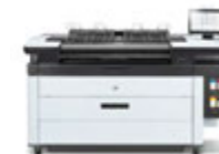
HP PageWide XL 5200 MFP