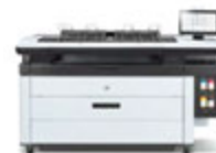
HP PageWide XL 5200