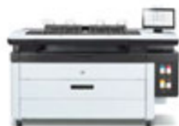
HP PageWide XL 4200