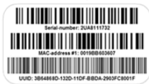
【1】ラベル貼付 (シリアル番号、Macアドレス1、UUID)