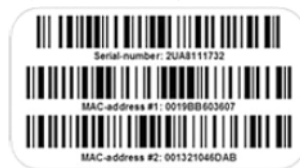
【2】ラベル貼付 (シリアル番号、Macアドレス1、2)