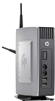
HP t510 Thin Client

保しつつ、ワークスタイル変革といった新たなニーズへの対応が求められていた。また、運用面では端末の一元管理が課題となっていた。