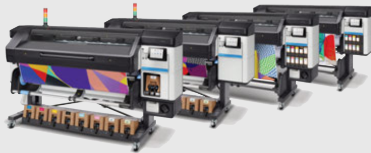
最新の第4世代 HP Latex 630 シリーズ