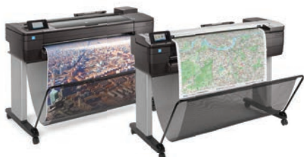
HP DesignJet T730 / T830 MFP