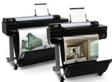
HP DesignJet T520 24inch/36inch