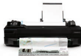
HP DesignJet T120