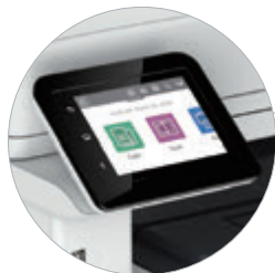
操作しやすい12.7インチ 液晶カラータッチスクリーン搭載