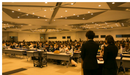
新入生約400名が集結した「ウェルカムキャンプ」