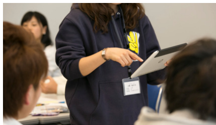
タブレットに資料を映し、グループワークをフォローするSA

BLPで重要なのが、スチューデント・アシスタント（以下、SA）と呼ばれる学生スタッフの存在。下級生をリードし、教員をサポートしながら授業の円滑な進行を担っている。