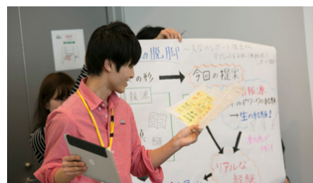
グループワークの成果をプレゼンテーションする新入生

プワークに取り組んだが、各部屋には担当教員とSAが1名ずつ配され、新入生をフォローした。「HP ElitePad 900」は18名のSA一人ひとりに渡され、ディスカッションや予選プレゼンテーションのタイムキーピングをはじめ、グループワーク進行に活用された。