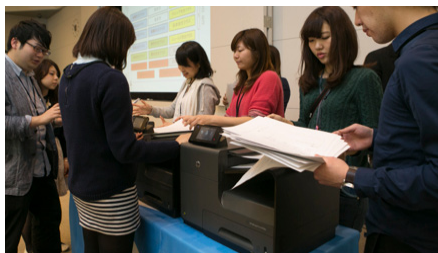
資料のプリントに活躍した「HP Officejet Pro X」