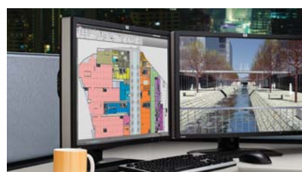
ワークステーションの画面を高速描画

PCoIPの開発元であるTeradici社の第2世代 Tera2チップを搭載し、PCoIPの処理に特化したゼロクライアントです。従来チップの5倍の描画性能を実現しており、標準で1,920×1,200の2画面構成にも対応しました。快適なレスポンスと操作性により、業務生産性の向上に寄与します。