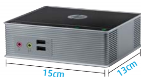
15cm×13cmのコンパクトボディ