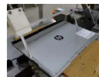
キックスタンドテスト 1万回以上の開閉

ディスプレイのガラスにはCorning® Gorilla Glass® 4を採用することで、頑丈さと薄さを両立。さらに、長い期間、安心してご利用いただけるよう徹底的な試験を実施することで製品化を行っています。キックスタンドは1万回以上の開閉、キーボード部の開閉は2万5千回以上、1千万回以上の打鍵テストを含む5万項目以上のテスト項目を実施し、さらに、米軍調達基準 (MIL STD 810 G) の高温、低温、凍結・解凍、高度環境、塵、砂、振動、衝撃、落下試験など、過酷なテストもクリアすることでワンランク上の耐久性を実証します。