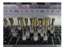
キーボード打鍵テスト 1千万回以上のキーストローク