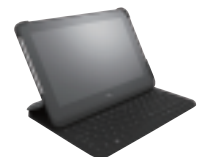
HP ElitePad キーボードジャケッ