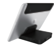
HP ElitePad ドッキングステーション