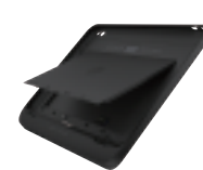
HP ElitePad 拡張ジャケッ