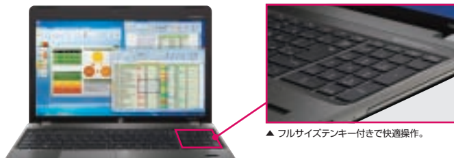
▲ フルサイズテンキー付きで快適操作。