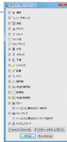
ホワイトボード機能

描画ツールにより文字だけではなく手書きの図形など、会議中にメモをとることができます。描画ツールはプレゼンターが許可することで参加者も使用できます。