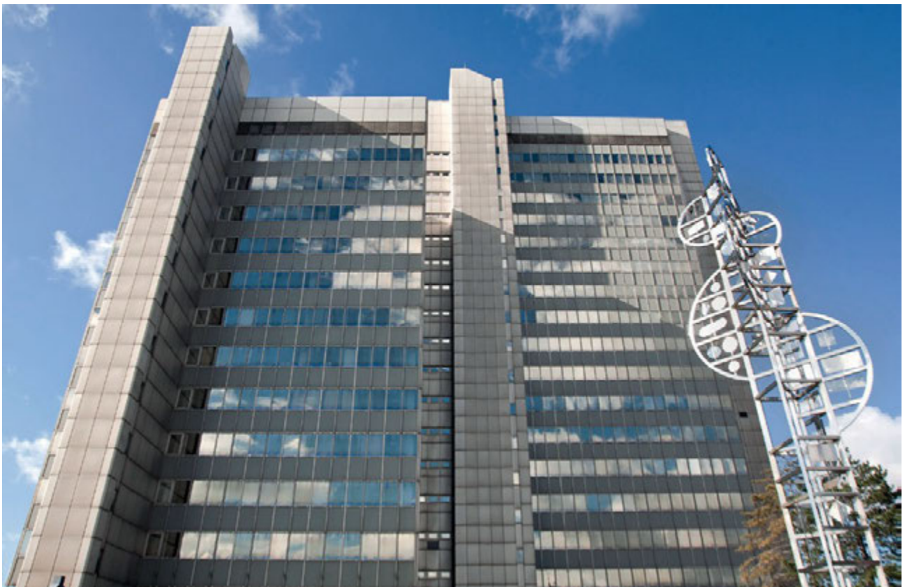
高さ72mの市庁舎は、連邦都市ボンの本部です。

機密データの保護は自治体において最も重要です。ここボン市では、イノベティブな方針を採用し、Bromiumソリューションを選択することで、従業員のエンドデバイスを保護し、それによって未知のマルウェアからも市民の機密データを保護しています。