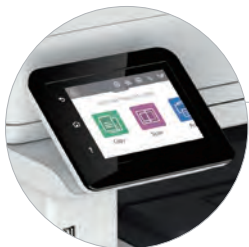
操作しやすい2.7インチ 液晶カラータッチスクリーン搭載